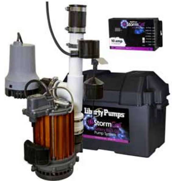
Se muestra el modelo PC237-441-10A